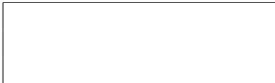
Схема границы балансовой принадлежности тепловых сетей

Прочие сведения по установлению границ раздела балансовой принадлежности тепловых сетей _____